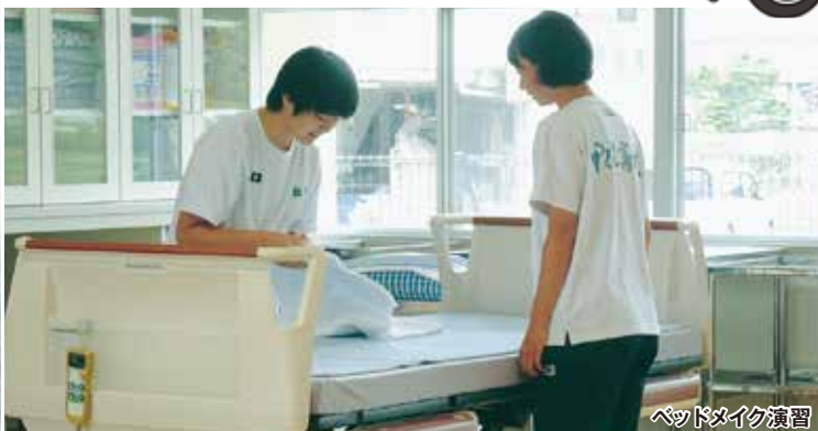
ベッドメイク演習