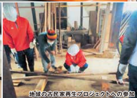
地域の古民家再生プロジェクトへの参加