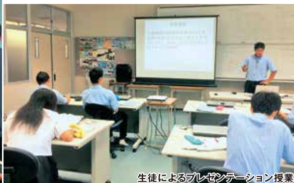
生徒によるプレゼンテーション授業