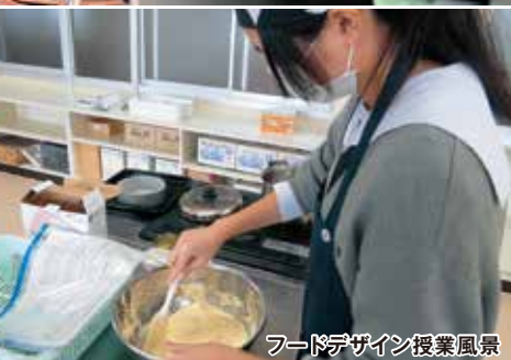
フードデザイン授業風景