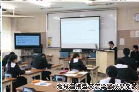
地域連携型交流学习成果発表