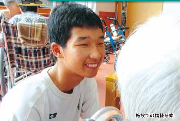
施設での福祉研修