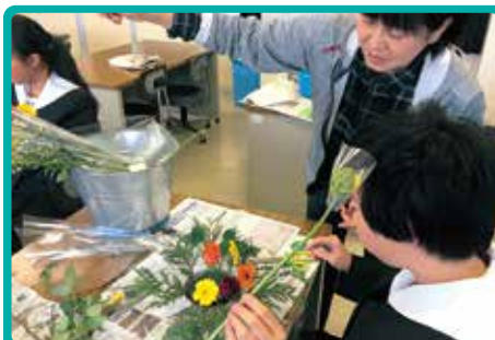
カルチャー倶楽部