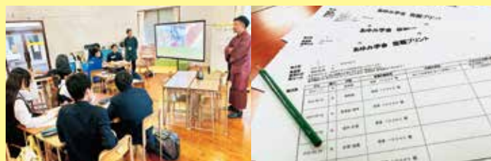
月約5回のゼミ授業

甲佐町公営塾あゆみ学舎は熊本県立甲佐高等学校の生徒を対象とした2017年11月開校の公営塾です。甲佐町と甲佐高等学校が連携して運営を行っています。生徒が社会に出て必要となる力を身につけるための様々な経験ができる機会をつくり、一人ひとりが「なりたい自分」を見つけその進路が実現できるよう、町・高校が一丸となって生徒を支援します。