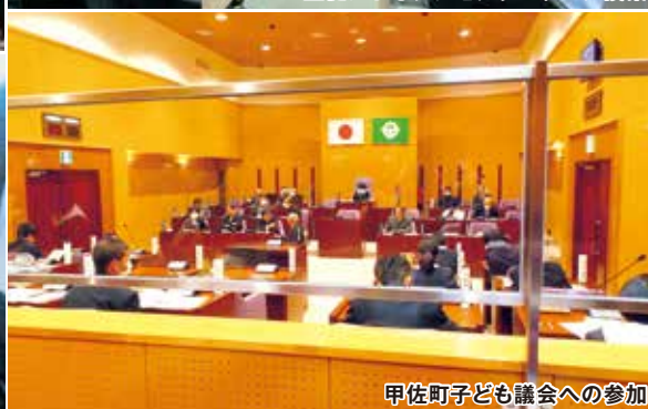
甲佐町子ども議会への参加