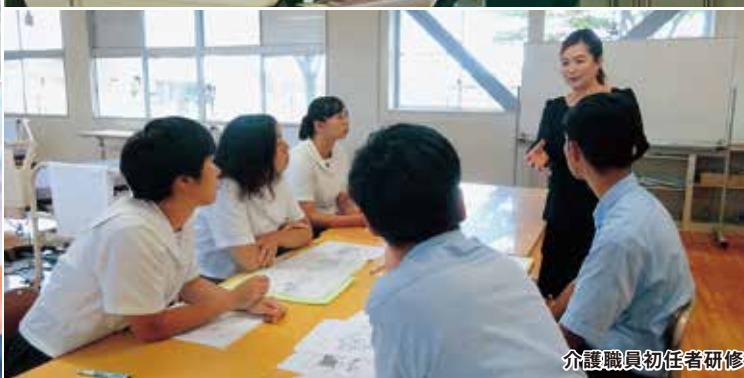
介護職員初任者研修