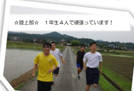
☆陸上部☆ 1年生4人で頑張っています!