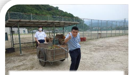
☆ボランティア部☆環境美化はお任せください