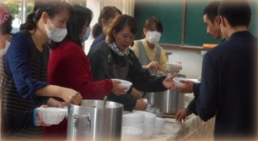
ゴールの後には、育友会で作ってくださった美味しい豚汁が待っていました!