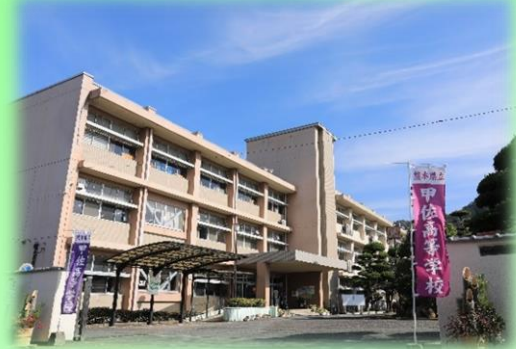
「穏やかな年明け」

～今年は穏やかで暖かな年明けになりました。そのような1年となるように願いを込めて～