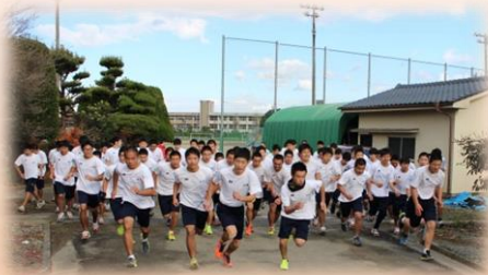
男子一斉にスタート!

12月16日(金)に長距離走大会を実施しました。寒さに負けず走り抜き、全学年の生徒が制限時間内にゴールすることができました。