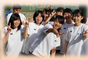
笑顔を忘れず走ります♥