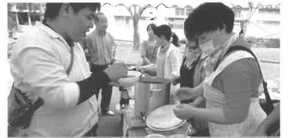
昨年度はバザーで豚汁を 販売しました