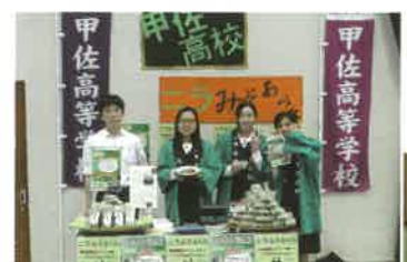
▲ならみそあられの販売