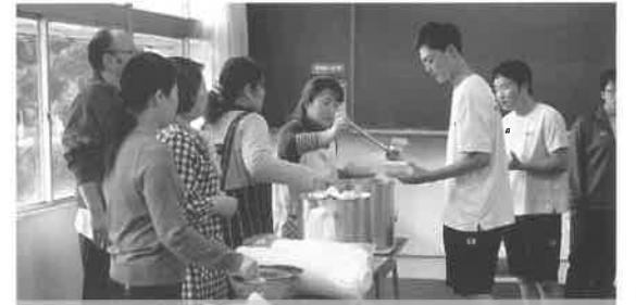
長距離走の後には おいしのだご汁をふるまいました