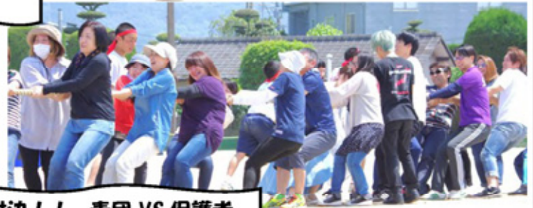
親子対決!! 青団 VS 保護者