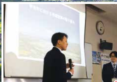
地域振興についての講演会

昨年度は、国指定史跡である陣ノ内城跡の案内及び、「甲佐町における地域振興の取り組み」をテーマにした講演会など貴重な学びの機会をいただきました。