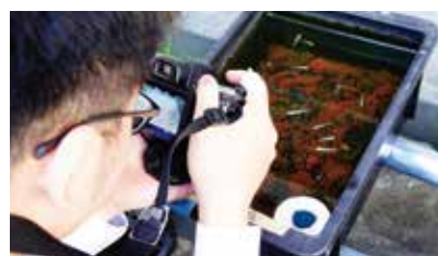
カルチャー倶楽部