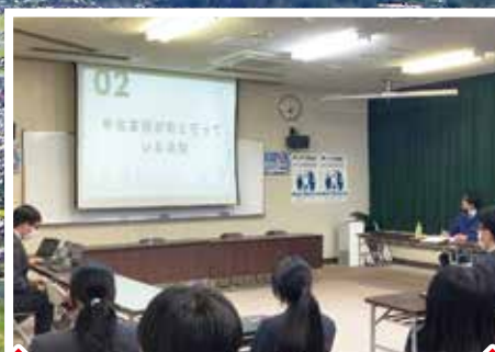
生徒から町へ発表