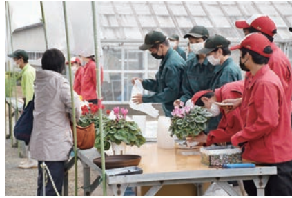
農産物販売会【シクラメン】