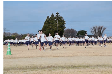
ロードレース【みんなでスタート】