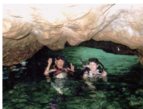
カケロ島 (平成24年8月)

「あの夜、助けてくれてありがとう。」この一年で、人との繋がりの大切さや多くのことを学びました。皆様の優しさや暖かさに感謝しながら、二度目の卒業を迎える日までもう少し頑張ってみようかと思っています。