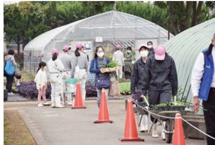
農産物販売会【花苗】