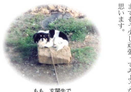
もも 玄関先で木の上に乗って番犬をしています。

「あの夜、助けてくれてありがとう。」この一年で、人との繋がりの大切さや多くのことを学びました。皆様の優しさや暖かさに感謝しながら、二度目の卒業を迎える日までもう少し頑張ってみようかと思っています。