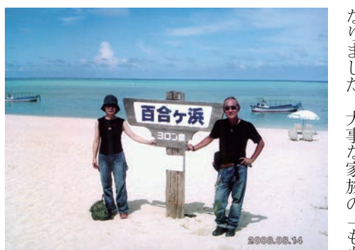
ヨロノ島 (平成20年8月)