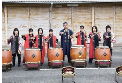
農産物販売会【太鼓部】