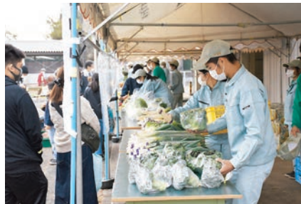
菊農フェスタ農産物販売会 11月6日(土)【野菜】