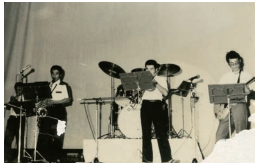
若いとき、バンドをやっていました。ギターを弾いているのが私です。(旧菊池市体育館 昭和54年9月)