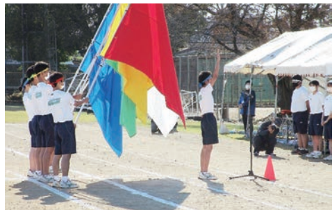
体育大会 10月29日(金)【選手宣誓】

緑水会会員の皆様におかれましては、益々ご健勝のことと心からお慶び申し上げます。 歳月が経過するのは、早もので緑水会の会長を仰せつかり三年が経過しようとしております。 この間、新型コロナウイルスの感染拡大により世の中の全てのごとに制限、制約がかり社会・経済活動は大きな影響を受けて参りました。この様な中ではありましたが、同窓会活動にしましては、会員皆様をはじめ学校関係者の皆様から温かいご支援とご協力を賜り、ここに改めて御礼申し上げます。 さて、我が国の農業や農村を取