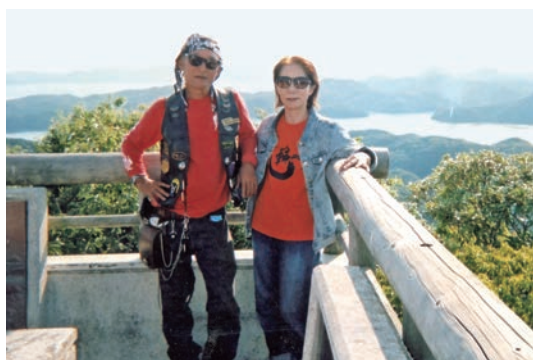
長崎県対馬 (平成26年8月)