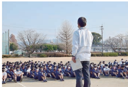
ロードレース大会 12月10日(金)【開会式】