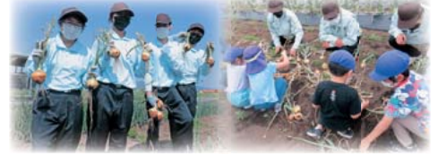
園児との交流 タマネギ収穫