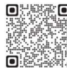
畜産科学科新着情報

畜産科学科では生産動物（乳牛・和牛・豚・鶏）の他に、伴侶動物、野生動物、乗用馬を飼養管理しています。その中で、動物の管理の大変さと、命の大切さを学ぶことができます。1年次から2年次では、全ての部門で経験を積み、3年次で自分の進路に合わせて専攻を選ぶことができます。とても、やりがいを感じることができる学科です。動物が好きの方、少しでも畜産に興味がある方、ぜひ動物と同じ時間を過ごしましょう。