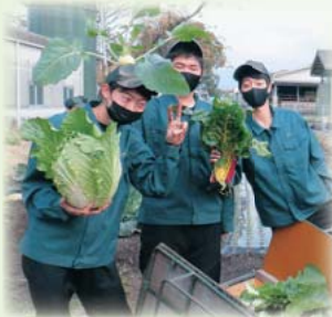
農業と環境 野菜の収穫