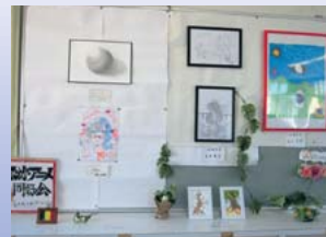
美術・漫画・アニメ