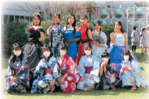
浴衣&ドレス制作・披露