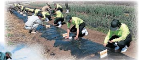
一人一畑で野菜づくり