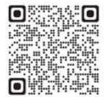
生活文化科新着情報

生活文化科の魅力は、農業と家庭科の両方を学習できることです。農業の授業では、草花や野菜の栽培、家庭科の授業では被服や調理、保育などを学びます。家庭科技術検定や情報の検定も受け、実力アップを図ります。3年生になると、草花・被服・調理に分かれ、さらに専門的に。ファッションショーや体育大会などの行事も学科やクラスで団結し、楽しんで取り組んでいます！