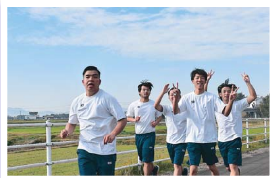
ロードレース大会