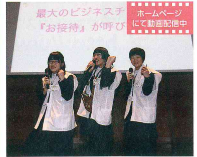
ファイナリストによるプレゼンの様子