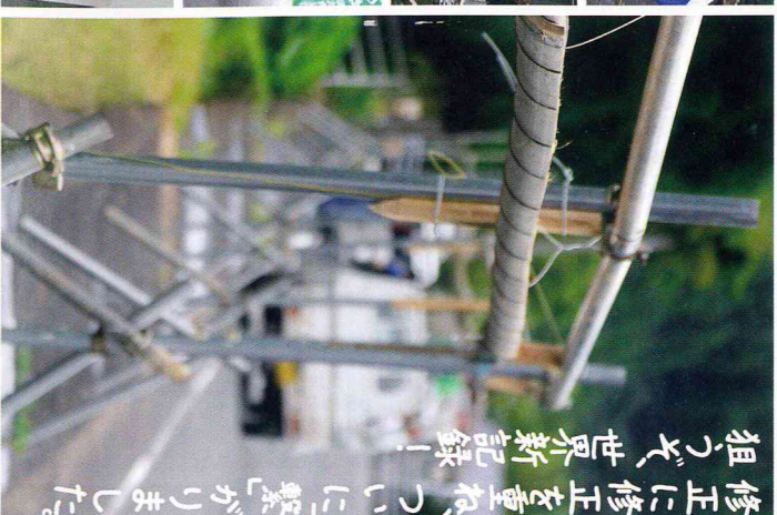
修正に修正を重ね、ついに繫「がりました」狙って、世界新記録！

菊池高校商業科の生徒たちが、菊池市が取り組む「水まっ竜門ダムから旧龍門小跡地までプロジェクト」に企画を提案して始まった「世界一長い流しそうめん」。プロジェクトのテーマは「繫プロジェクト」のテーマは「繫（なぐ）。世界記録を目指しながら、竹をつなぎ、人をつなぎとも目標にしました。6月頃に新記録3328・38mに生徒や林業研究クラブなどの団体で実行委員会を設立。それを達成！