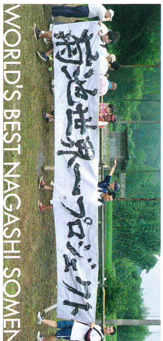
WORLD'S BEST NAGASHI SOMEN