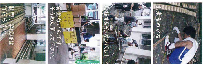
出てくるのかな 様子を「かん」 資金ないんで「そめい」 そのめん買って下さい。 龍門小学校跡は 竹だらけ