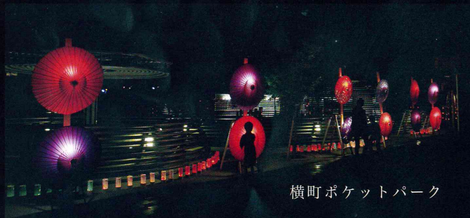
横町ポケットパーク