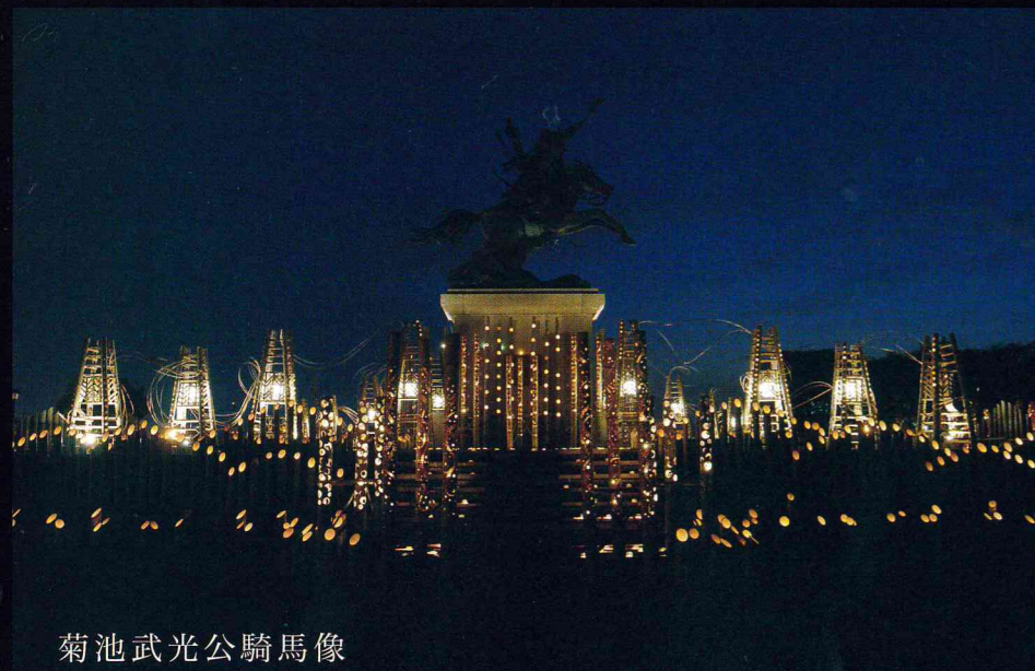
菊池武光公騎馬像