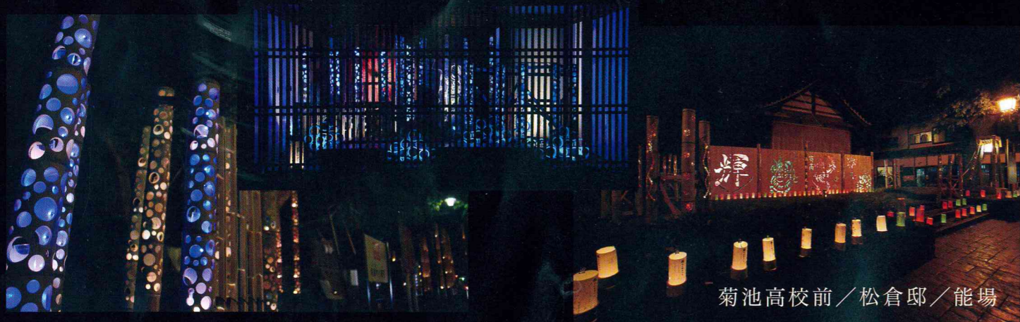
菊池高校前／松倉邸／能場

平成28年11月18日（金）～12月3日（土）期間中の金・土曜日 ※11/18（金）・11/19（土）・11/25（金）・11/26（土）・12/2（金）・12/3（土）全日程17:00～21:00（雨天中止）