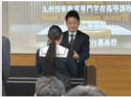
スマートアクティ