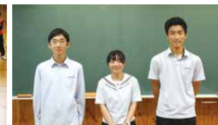
生徒会新執行部「みんな待ってるよ～」