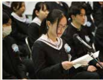
卒 業 式