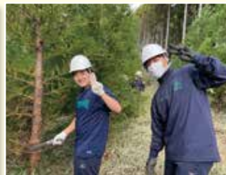
育友会林体験作業