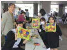
芸 術 (美術)