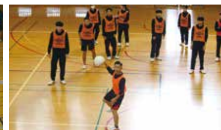
2学期クラスマッチ