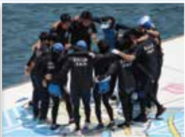
ボート部 (ローイング)