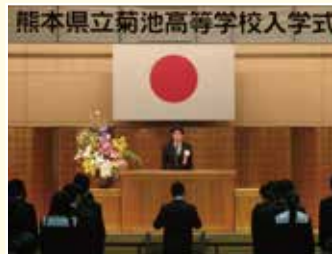
入 学 式