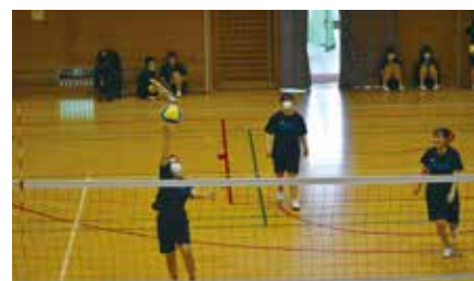
1学期クラスマッチ