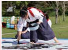
芸 術 (書道)

私たち書道部は、学校行事やお祭りでの書道パフォーマンス、そして書道展への出品を主な活動としています。パフォーマンスでは、出演の依頼を受けてから部員全員で構成や音楽を考え、一体感のあるステージを作り上げています。パフォーマンス後に観客の皆さんから温かい言葉をいただくことが、私たちの大きな喜びとやりがいにつながっています。 書道展に向けては、各自が選び抜いた古典作品と向き合い、納得のいく作品を完成させるために日々練習に励んでいます。常に、納得のいく作品が仕上げられるように心がけ、大会や展覧会での入賞を目指しています。 少しでも書道に興味を持っていただけたら、ぜひ入学後の体験入部にお越しください！部員一同、心よりお待ちしております。