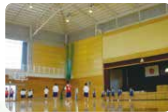
体育館メインアリーナ