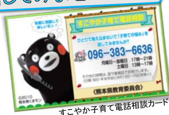
すこやか子育て電話相談カード