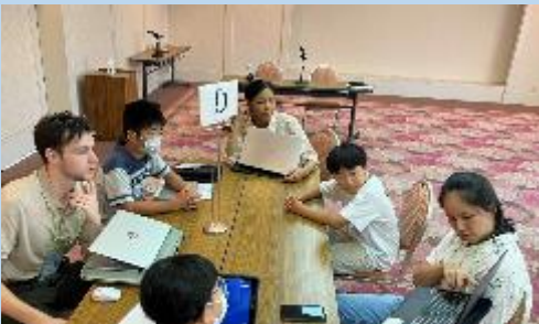
ALTのふるさと自慢を聞いて、様々な国の様子を知ることができました

熊本県では、グローバル人材の育成に向けて、県内の小中学生等を対象にALT（外国語指導助手）と交流する活動を実施しています。「Do you know my hometown?～ふるさと自慢in English!～」のテーマのもと、子どもたちは、ALTに自分が住む地域のよさを英語で伝える活動などを通して、英語によるコミュニケーションの楽しさを実感し、これからの英語学習への意欲を高めていました。