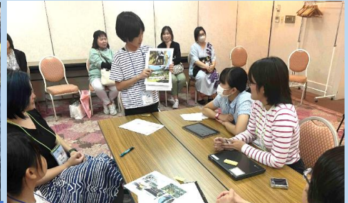
県内から集まった友達の発表を聞き、各地のふるさとのよさを発見しました