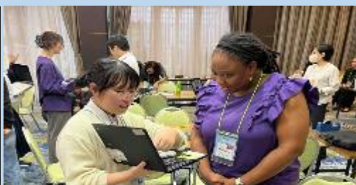
最後に、ALTと1対1になり、自分のふるさとを紹介しました。多くのALTとのかかわりを通して、徐々に自信をつけ、英語によるコミュニケーションを楽しみました