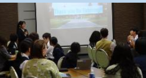
州立モンタナ大学派遣高校生の発表を聞き、留学への興味が高まりました