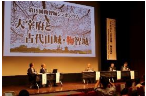
（パネルディスカッションの様子）

鞠智城シンポジウムの発表要旨は「全国遺跡報告総覧」にアップロードされています。ぜひご覧ください。