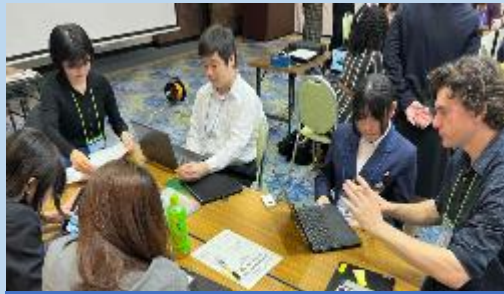
ALTとコミュニケーションを図りながら、ふるさと自慢の発表内容を練り上げました