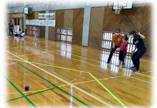
山鹿市スポーツ委員