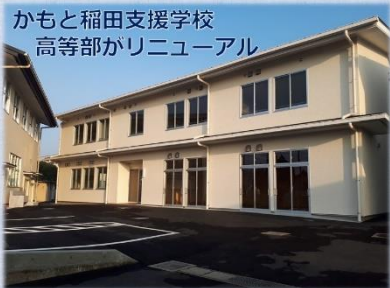
かもと稲田支援学校 高等部がリニューアル