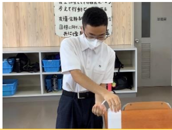
アルコール ワンプッシュ