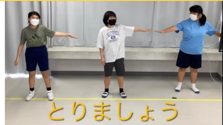
人と人のきより♪ 人と人のきより♪