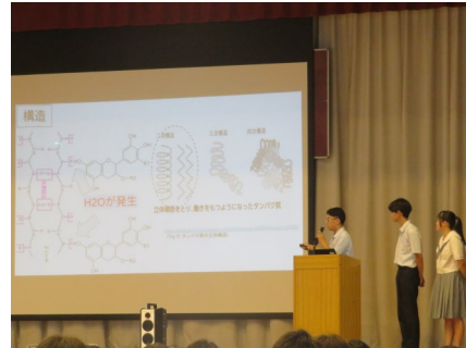
③バイオプラスチックの合成