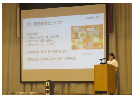
①お米プロジェクト ～地元のお米を生かした 商品開発目指して～