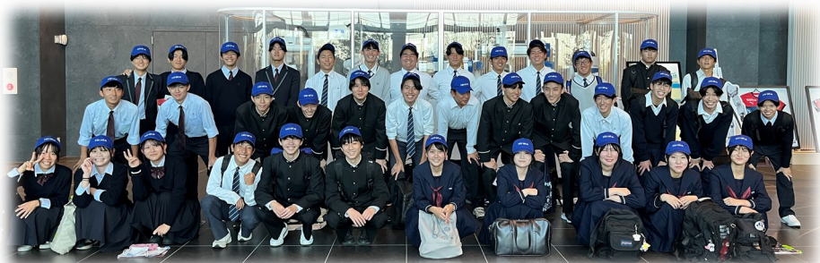
他校の参加者と一緒に記念撮影