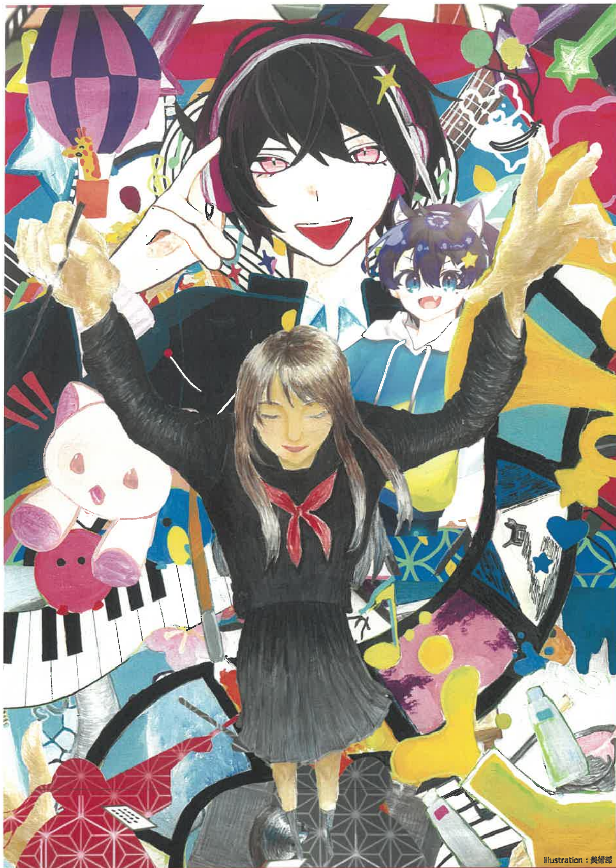
Illustration : 美術部