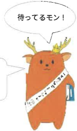
鹿本高校 名物キャラクター しかモン