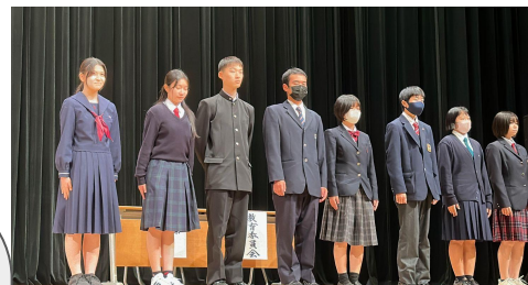
表彰式（受賞した学校↑）

昼休みなどの空き時間を使い意見や案を出し合いながら作成しました。このような結果がでて嬉しく思います。これからも健康や生活のためになる情報を発信していきますのでぜひ読んでいただくと幸いです。（後輩が頑張るはずです）