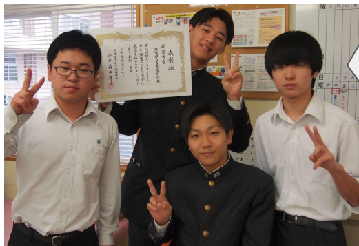
昨年の保健だより係(3年生)