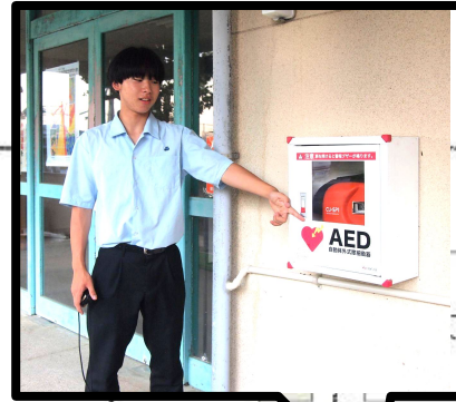
体育館 運動場側入口