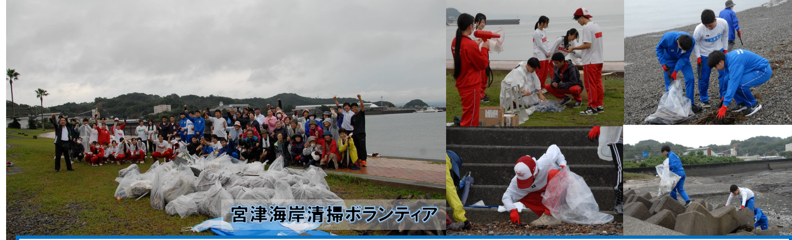
宮津海岸清掃ボランティア

10月26日、本校主催で「宮津海岸の清掃」を実施しました。海岸に漂着したごみのなかには、大きな流木やタイヤも。生徒たちにとって、「地域の環境問題」について考えるきっかけにもなったようです。そしてこの日は、地域の皆様から、多くのご協力をいただきました。ありがとうございました。