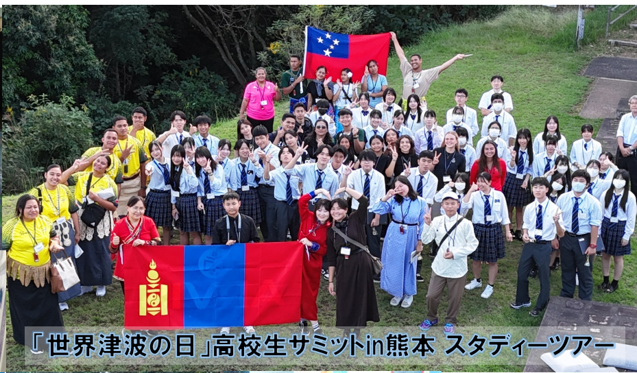
「世界津波の日」高校生サミットin熊本 スタディーツアー

10月21日、「天草ビジターセンター」において、「サモア・トンガ・ハワイ・フィリピン・モンゴル」の高校生と、本校2学年の生徒たちが交流活動を実施しました。