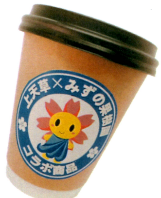
パール感動ドリンク