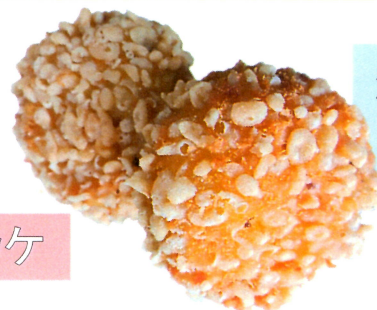
海山ミックス コロッケ