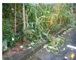
猿の被害にあった分校農園

特に丸々と育った食べ頃の3個のスイカは、登校日のボランティア終了後に全員で頬張る予定でしたが、出来映えを堪能することは叶いませんでした。