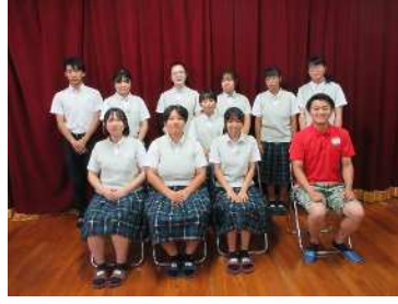
【代表生徒による集合写真】