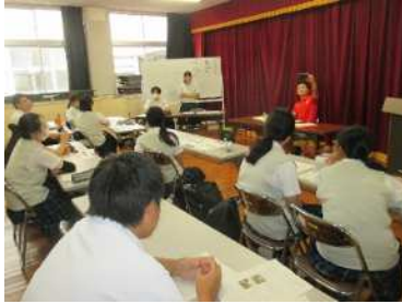
【実行委員会の様子】