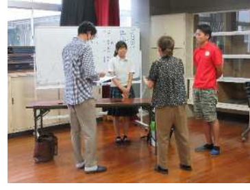
【取材を受けている様子】