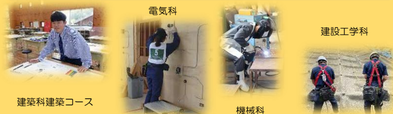
建築科建築コース

工業教育を中心とした全ての教育活動をとおして、「 規範意識と主体的行動力 」、「 豊かな感性と責任感 」、「 思いやりと郷土愛の心 」を育み、人吉・球磨地域の復興・発展や次世代を担う産業人材を育成します。 本校の育成する資質能力 ☆第 2 3 回高校生ものづくりコンテスト 家具工芸 (九州大会最優秀賞) ☆九州大会、インターハイ出場部活動 陸上競技部、カヌー一部、柔道部