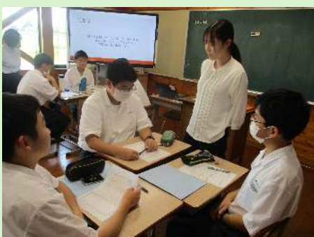
テーマ「感情の理解」 (相手の気持ちを想像する学習)