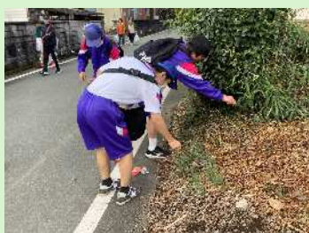
地域花いっぱい&クリーン大作戦