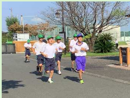
保健体育(ジョギングタイム)