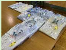
洗濯・仕上げをする