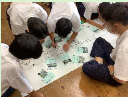
「ひのくに安全隊」グループ (学校周辺の安全マップ作り)