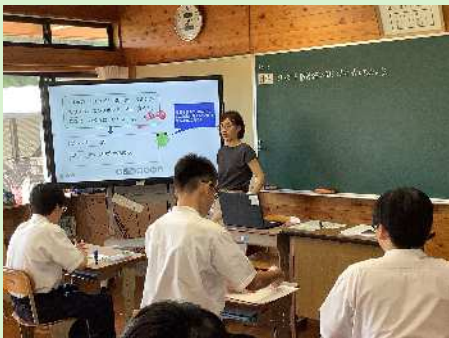
数学(学習グループ別)