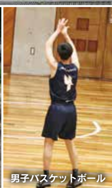
男子バスケットボール