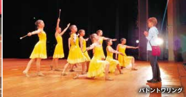
バトントワリング