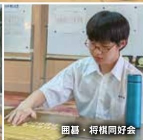
囲碁・将棋同好会