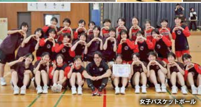
女子バスケットボール