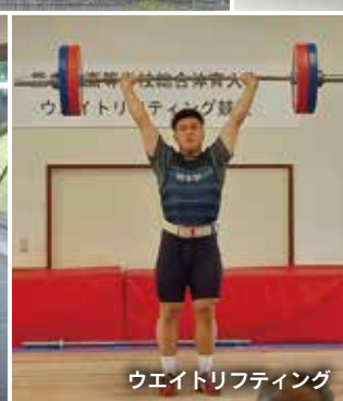
ウエイトリフティング