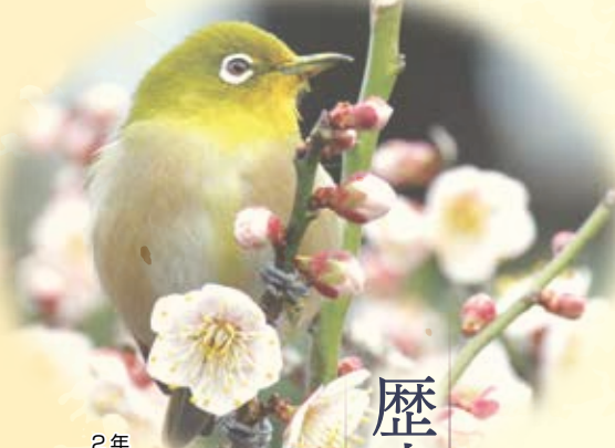
2年 野田真言さん撮影