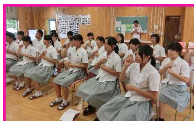
手話歌の練習風景（3W）