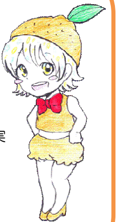
芦高キャラクター プリンセス・アグリ

今回収穫したお米は精米し、芦高祭で販売します。1kg300円でお値打ち価格になっています。手塩に掛けた芦高のお米をぜひご賞味下さい。