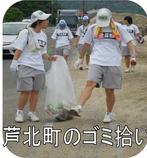
芦北町のゴミ拾い

※地域貢献ボランティアの様子は6月21日(土)付けの熊本日日新聞に掲載されています。ぜひ、ご覧ください。