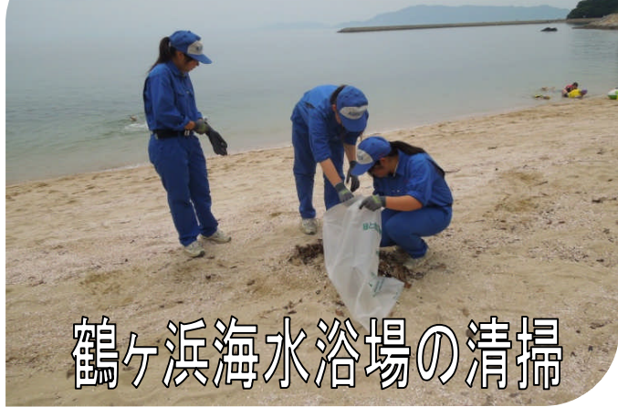
鶴ヶ浜海水浴場の清掃