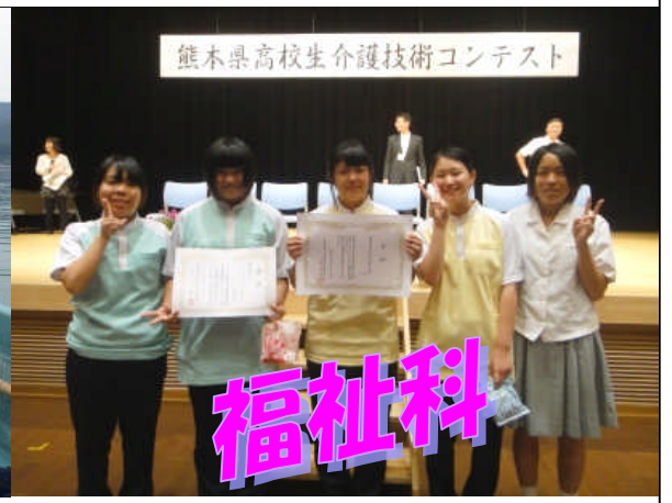
熊本県高校生介護技術コンテスト