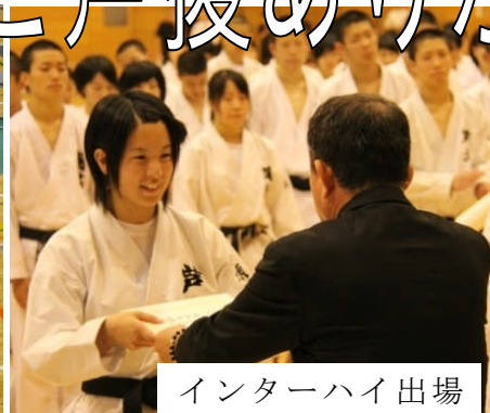
インターハイ出場