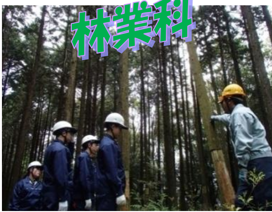
1年林業科演習林実習

1年林業科の初めての鏡山演習林実習を1泊2日の日程で実施しました。今年の1年生は少人数ながら実習を一生懸命頑張り、例年通りの実習をケガも無く、安全に行うことができました。