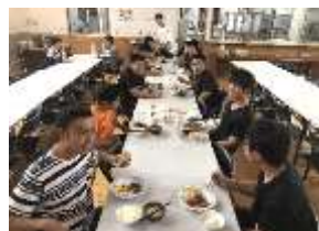
< 朝の食事風景 >