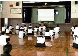
新入生オリエンテーション