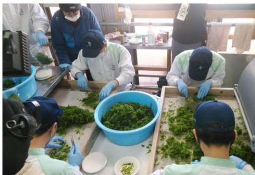
ゴミの除去作業中