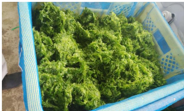
新鮮なアオサ！綺麗！