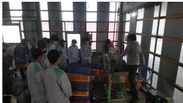
真剣に説明を聞きます