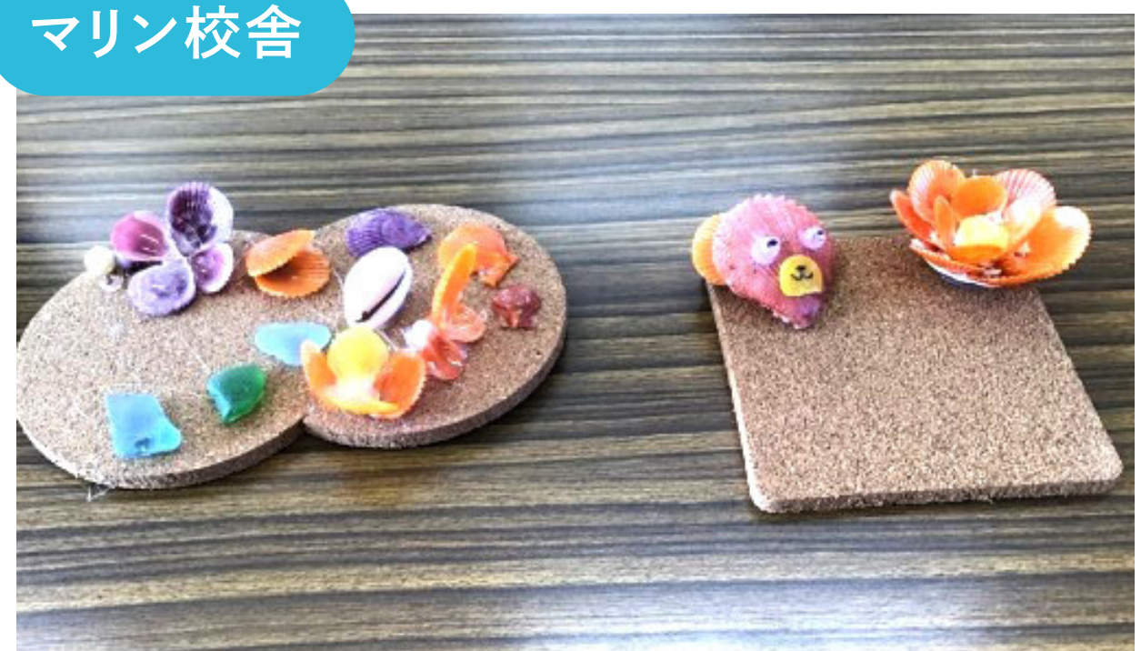
ヒオウギ貝のコースターとマグネット ワークショップ