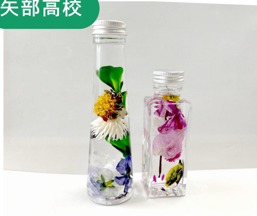
ハーバリウム ワークショップ