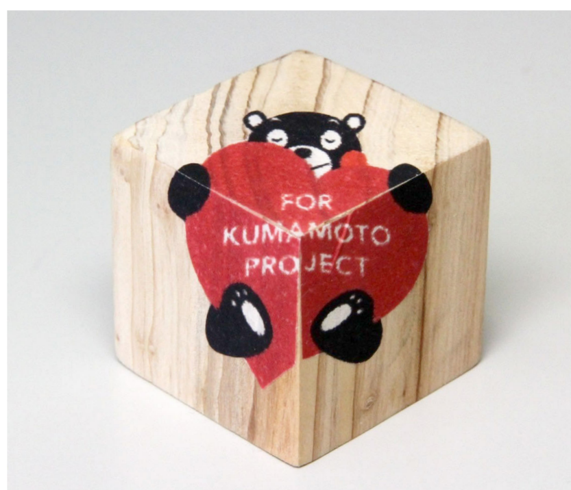
かどっこ♡のくまモン ワークショップ