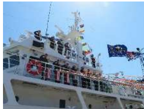
海洋科学科 海洋航海コース