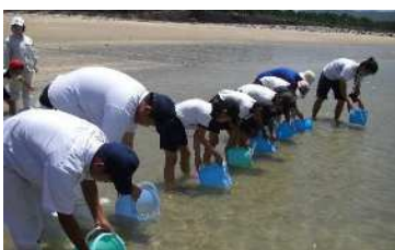
富岡での稚魚放流