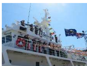
海洋科学科 海洋航海コース