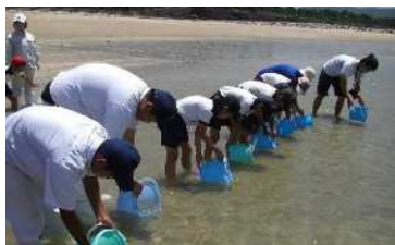
富岡での稚魚放流