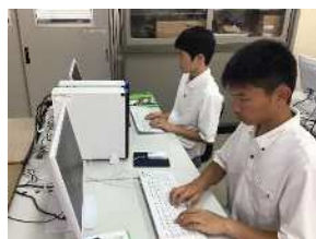
普通科総合コース