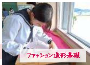
ファッション造形基礎