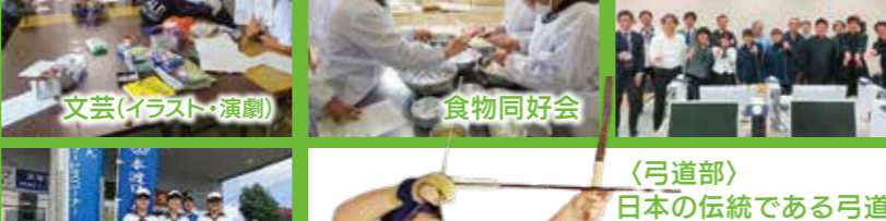
文芸(イラスト・演劇)