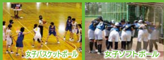
女子バスケットボール