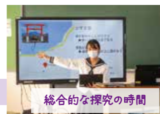
総合的な探究の時間