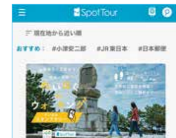
町の観光アプリ開発 【総合的な探究の時間】

商業系の授業では、簿記や情報について深く学びます! ※2年次より類型制 割合は1年次からの合計で計算