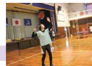
放課後 部活動 (15:50~)