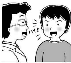
はっきり返事をする