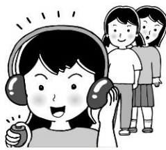
前の人のやり方を見ておく