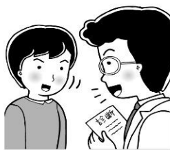
先生の話をよく聞く