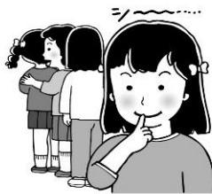
静かに順番を待つ