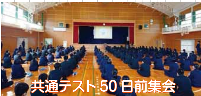
共通テスト50日前集会