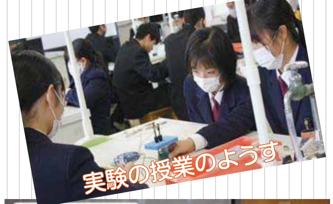
実験の授業のようす