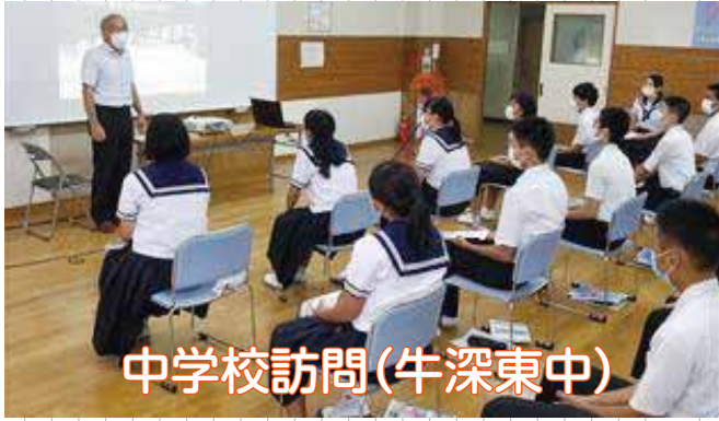
中学校訪問(牛深東中)