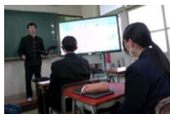
先輩から「極意」の伝授

まもなくAT IIの探究活動を終える3年生。まとめとして、天草市への「提言書」及び、課題研究を通して学んだことを、これまで「異学年交流」を通して共に活動してきた2年生に発表してくれました。