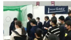
ミニドローン体験