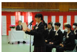
高等部入学式 教室では新入生を迎える準備中