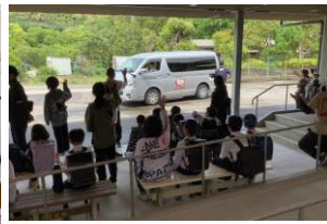
小・中学部下校の様子 正門が完成しました