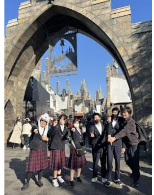
私も魔法使いになれるかも

高等部2年生。待ちに待った修学旅行に行きました。この日のために、集団行動や、事前学習を学年全体で取り組んで当日を迎えました。出発時の遅刻者は「0」、旅行中の体調不良者も「0」。トラブルもなく、事前学習の成果を発揮しました。ユニバーサル・スタジオでは、「魔法の国」を体験。大阪では、はじめての「人混み」を体験しました。クラスメイトとの絆が深まる3日間を過ごしました。