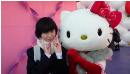
キティーとも仲良しに!