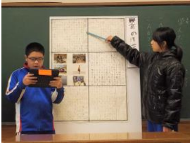
国語「新聞を作ろう」