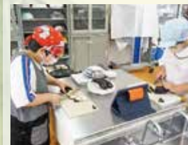
〈職業・家庭〉 「調理実習」