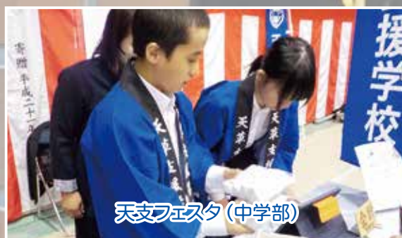
天支フェスタ(中学部)