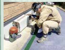
〈職業〉 「産業現場等における実習」