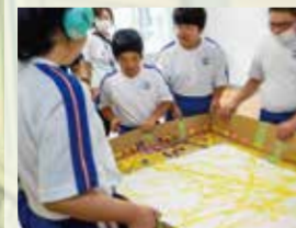
〈生活単元学習〉 「看板づくり」