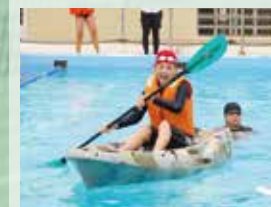
〈保健体育〉 「マリンスポーツ体験」