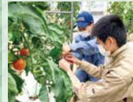
〈LHR〉 「天草拓心高校との交流」