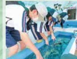
〈総合的な探究の時間〉 「天草青年の家に行こう」