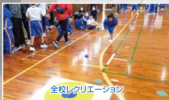
全校レクリエーション