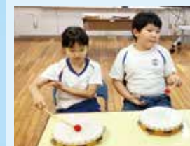
〈音楽〉 「打楽器に挑戦！」