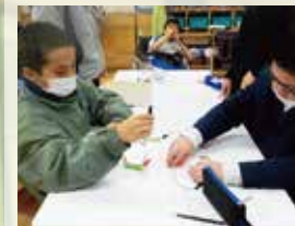
〈理科〉 「電気の通り道」