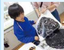
〈図工〉 「塗ってうつつて」