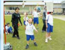
〈体育〉 「体力アップ!アップ!」