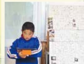
〈国語〉 「新聞を作ろう」