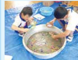
〈生活単元学習〉 「夏祭りをしよう!」