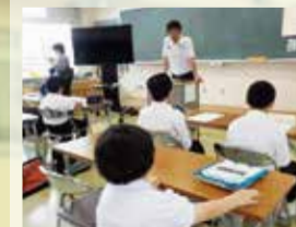
〈総合的な学習の時間〉 「高等部見学」